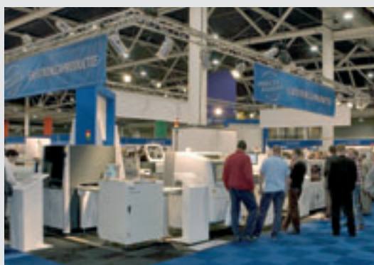
de Live PIL op de E&A beurs 2007 was een groot succes