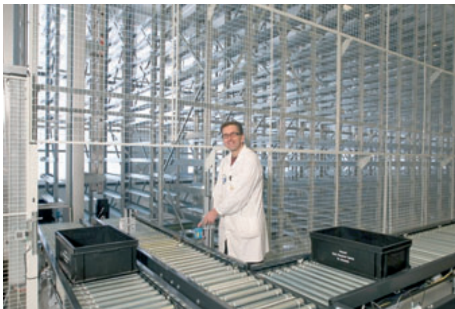
materialen naar de man in plaats van de man naar de materialen