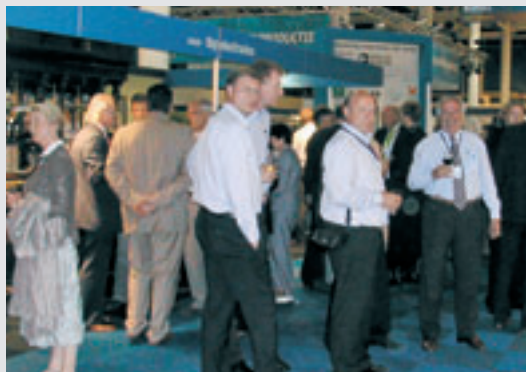
tbp's happy hour viel zeer goed in de smaak