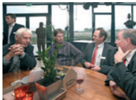
netwerking in het Grand Café