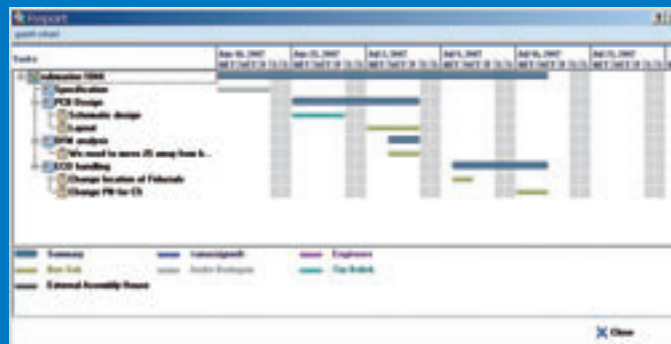
schermbeelden bij gebruik van CXInsight